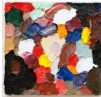
Jörn Keseberg: ohne Titel Öl auf Holz, 2012 42x44x4cm

auf Facebook folgen | E-Mail weiterleiten