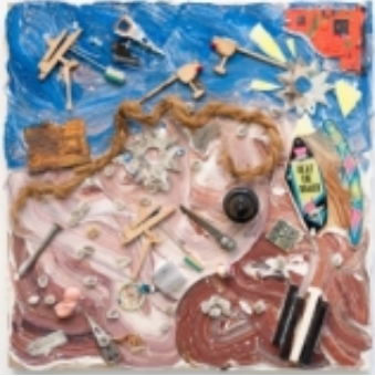
Jörn Keseberg: ohne Titel Assemblage, Mixed Media auf Holz, 2012 55x55x10cm